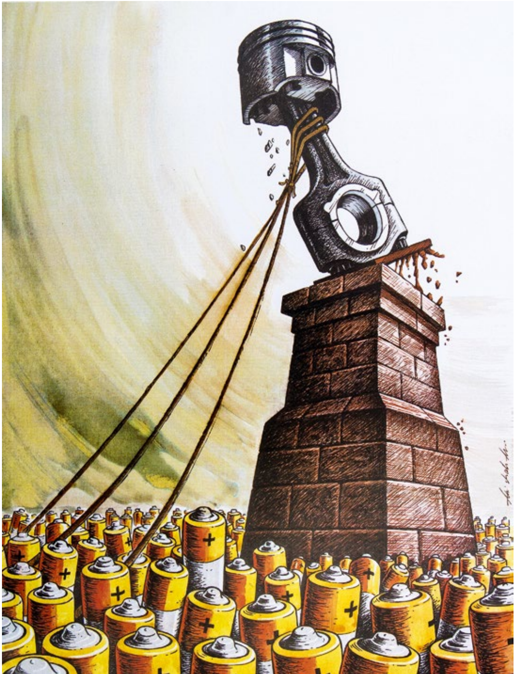
Ali Shahali (USA) 2. Preis «Silberne Feder»